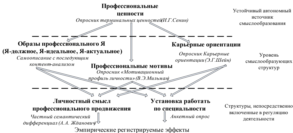
Рис. 1 Структура профессиональной Я-концепции

Аргументируется, что решению вышеобозначенных проблем способствует рассмотрение профессиональной Я-концепции с позиций деятельностно-смыслового подхода. В контексте последнего профессиональная Я-концепция определяется в диссертационном исследовании как динамическая смысловая система индивидуальных смыслов профессионального Я, которые отражаются в представлениях личности о себе как субъекте профессиональной деятельности. Среди структурных компонентов профессиональной Я-концепции в диссертационной работе рассматриваются: профессиональные ценности, образы профессионального-Я, карьерная ориентация, мотив профессиональной деятельности, личностные смыслы профессионального продвижения, установка работать по специальности (Рис. 1).