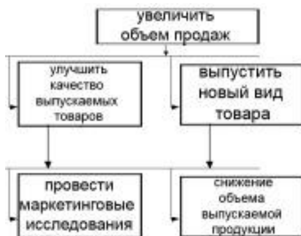
рис.2 сокращенное дерево целей

Когда составлено дерево целей, можно посмотреть, к чему приведет та или иная цель. Например, цель (рис.2) «выпустить новый вид товара» может привести к снижению объема ранее выпускаемых товаров и, как следствие, к совершенно обратному результату – снижению прибыли. Именно дерево целей позволило это увидеть. А также, именно дерево целей позволит скорректировать данную цель и создать либо дополнительные рабочие места, либо, к примеру, проанализировать выпускаемую продукцию с целью выявления продукта с минимальной прибылью, дабы именно его заместить новым продуктом.