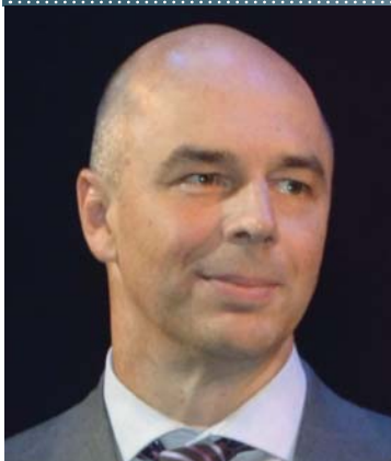
Антон Силуанов, Министр Финансов Российской Федерации:

Ассоциация региональных банков России (Ассоциация «Россия») – первое банковское объединение, созданное в целях защиты прав участников банковского сектора, привлечения в регионы капитала и развития региональных банковских рынков, а также совершенствования всех финан-