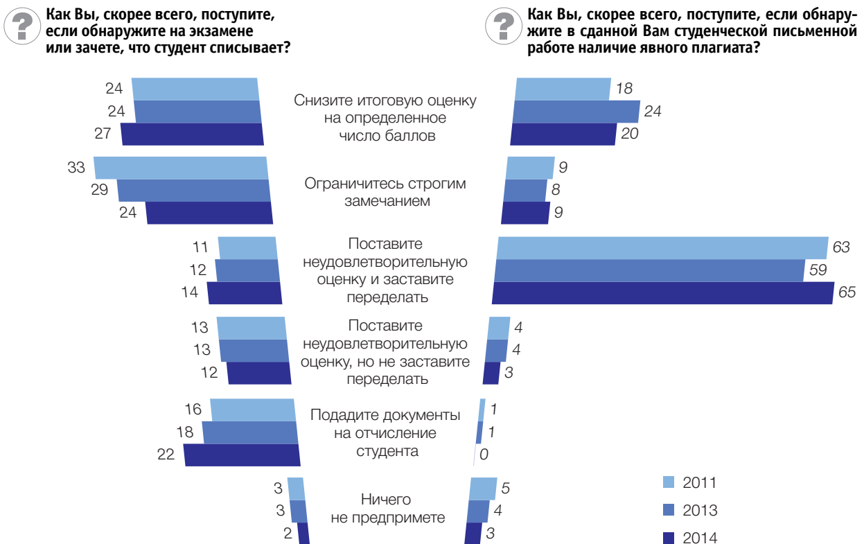
Рис 1. Меры при обнаружении факта списывания на экзамене (зачете) и плагиата в работе студента: опрос преподавателей (в процентах от численности ответивших)

Распространенность проверки студенческих работ на плагиат несколько выросла – с 54% в 2013 г. до 62% в 2014 г. (табл. 3). В 2013 и 2014 гг. примерно одинаковое количество выразили уверенность, что такая проверка обязательна для всех работ (27–28%), а доля ответивших, что она обязательна только для некоторых, увеличилась с 26 до 35%. При отсутствии обязательности проверки ее делали самостоятельно