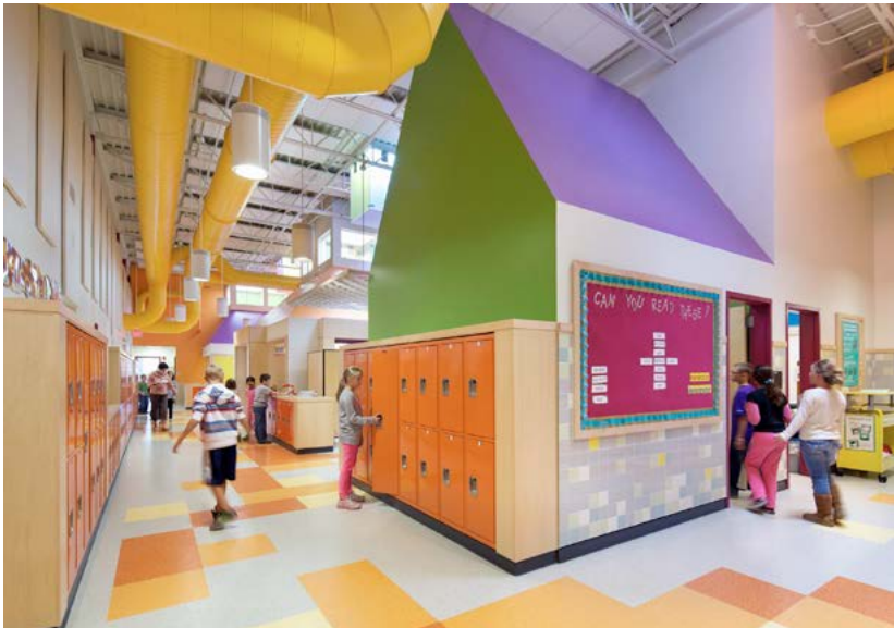
Concord Elementary Schools (Mill Brook School)

В тенденциях оформления и организации мест для хранения личных вещей большинство голосов младших школьников было отдано в пользу функциональных помещений, в которых помимо зоны хранения есть зоны рекреации: помещения с ярким оформлением (оранжевый, зеленый цвет) с разными видами мебели, помимо шкафчиков: диванами, столами.