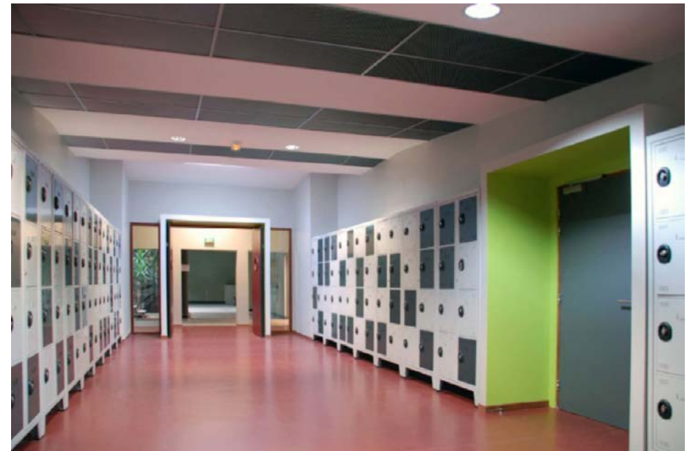
regional agricultural school in Mirecourt