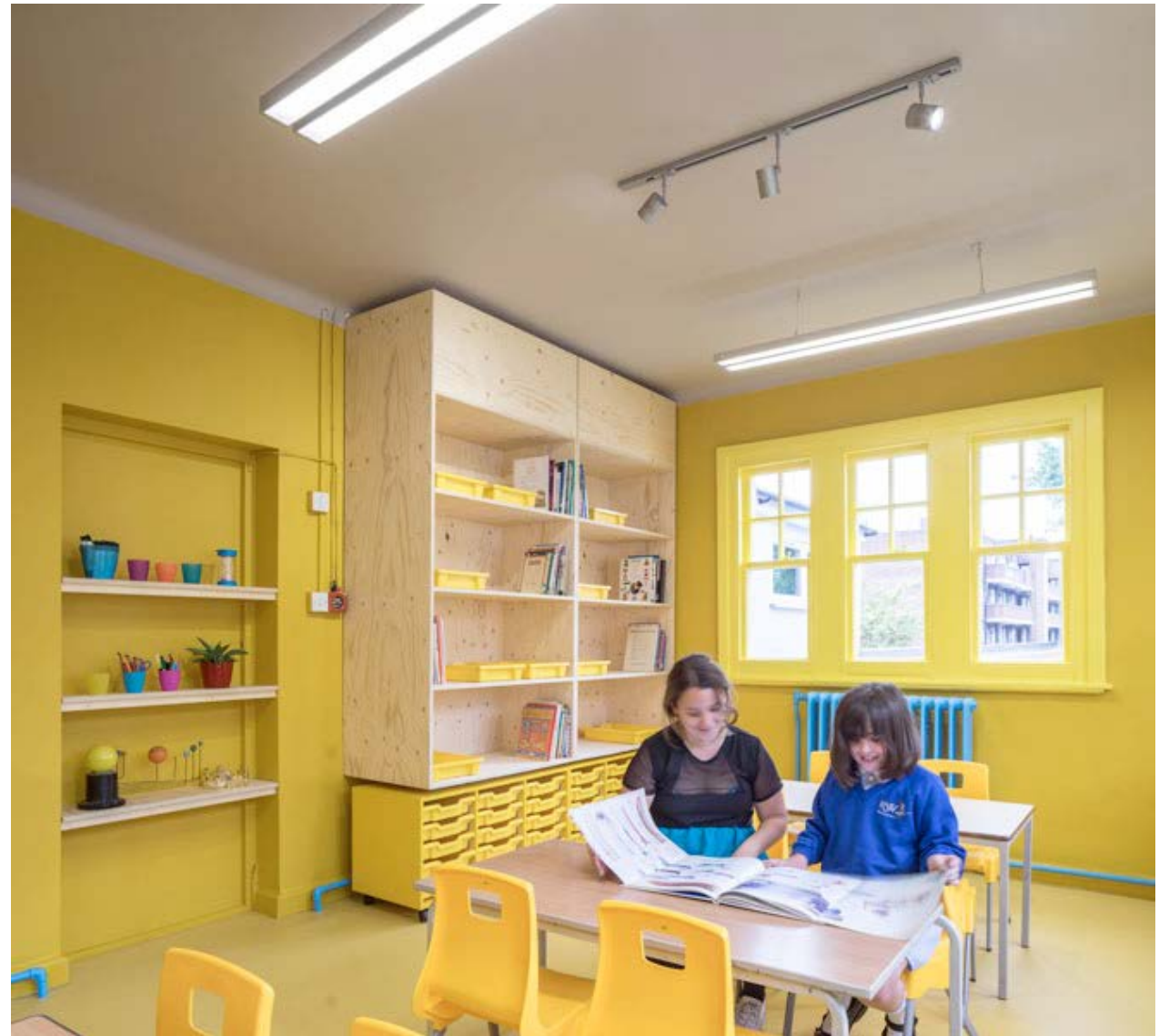
Rosemary works school