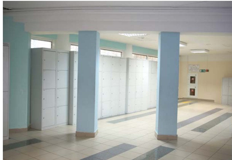
Школа № 1329 Москва