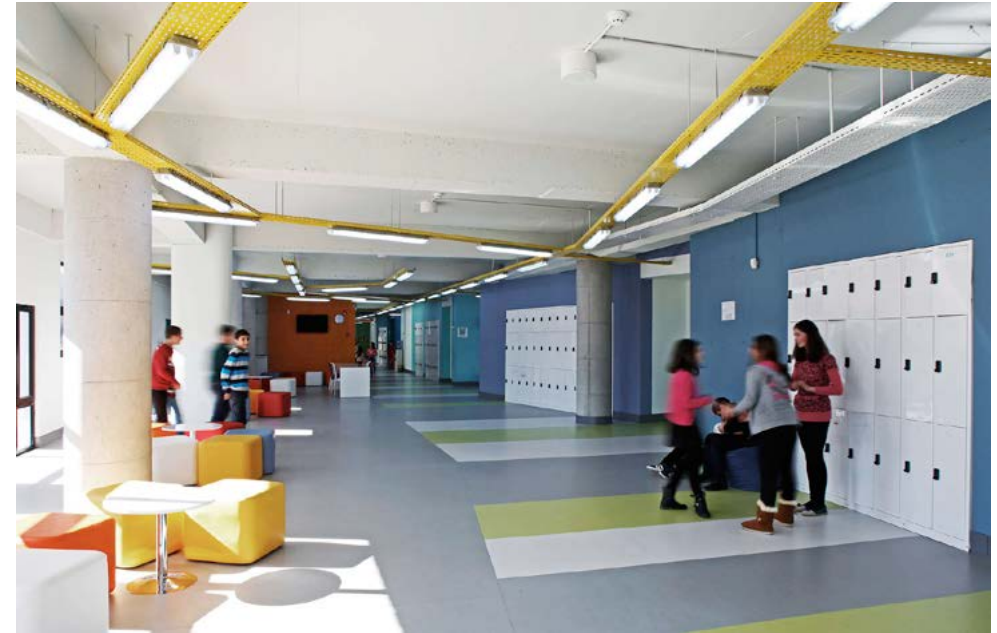
Dilijan Central School

В тенденциях оформления и организации мест для хранения личных вещей большинство голосов было отдано в пользу расположения ячеек для хранения в просторных коридорах: помещения со спокойным оформлением (зеленый цвет) с минимальным количеством дополнительной мебели.