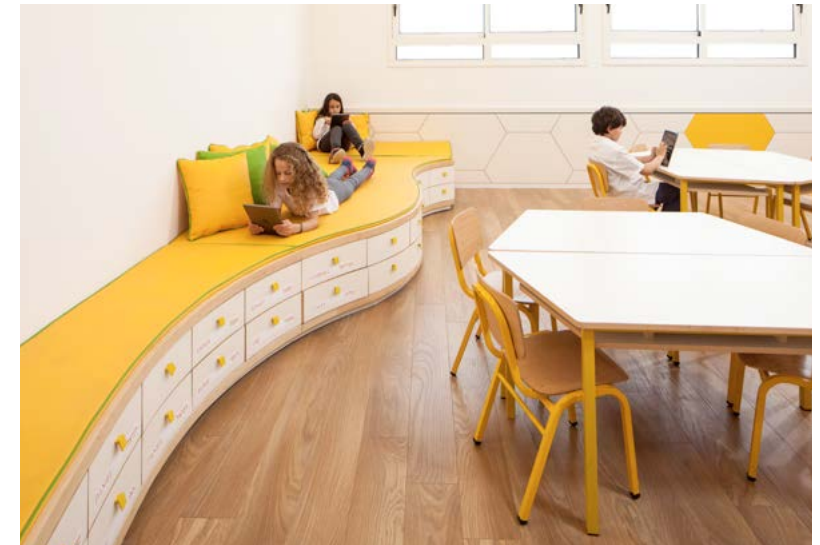
King Solomon Elementary School