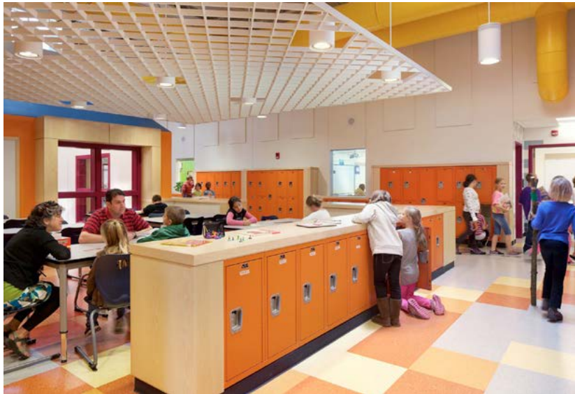
Concord Elementary Schools (Mill Brook School)

Решения систем хранения для начальной и средней школы, учителей должны быть различны.