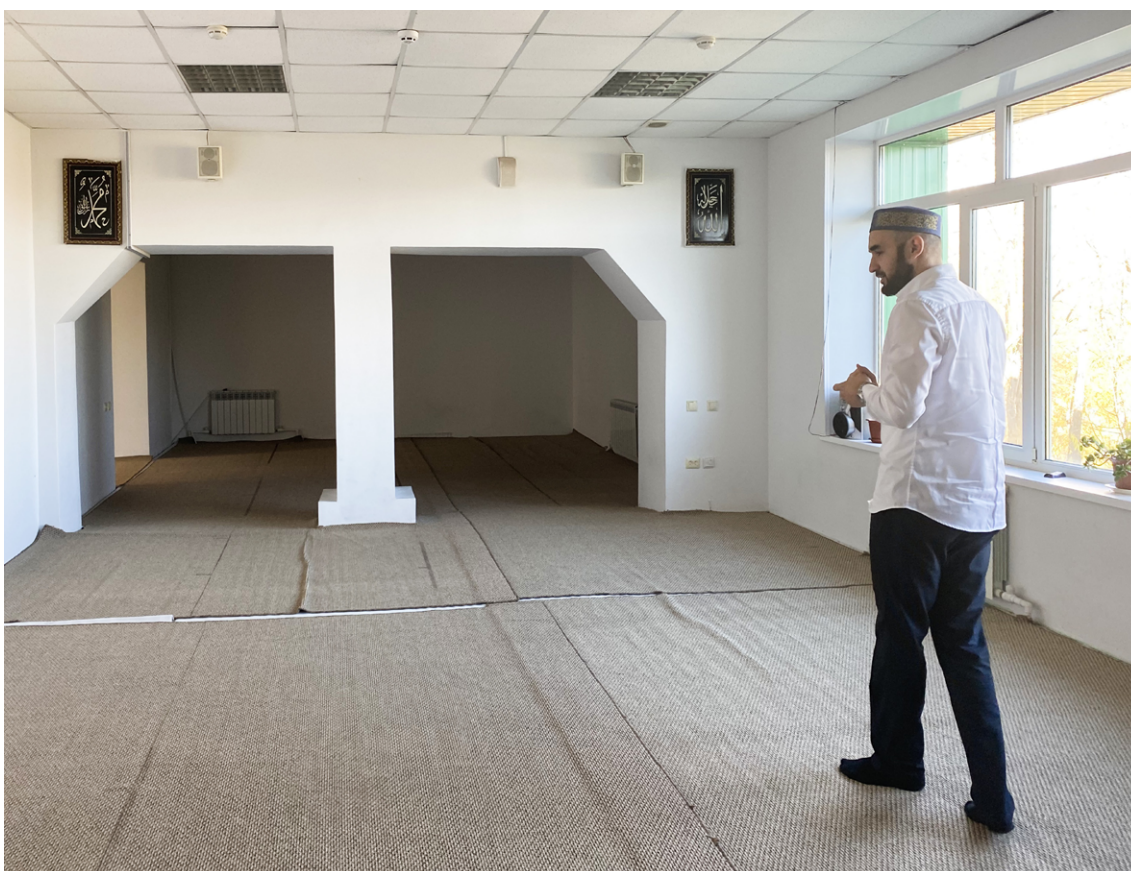
Молельный зал в Петропавловске-Камчатском.

Довольно-таки часто, раз в две недели точно, у нас бывают акции различные. Мы узнаем о малообеспеченных семьях, многодетных семьях и развозим продукты питания. Если есть возможность, помогаем материально одеждой. Буквально сегодня, если на входе видели, нам принесли сумки с одеждой, и мы собираем и сортируем... У нас буквально вчера картошку привезли почти полтонны. И мы раздаем все у нас. (Имам молельного зала в Петропавловске-Камчатском)