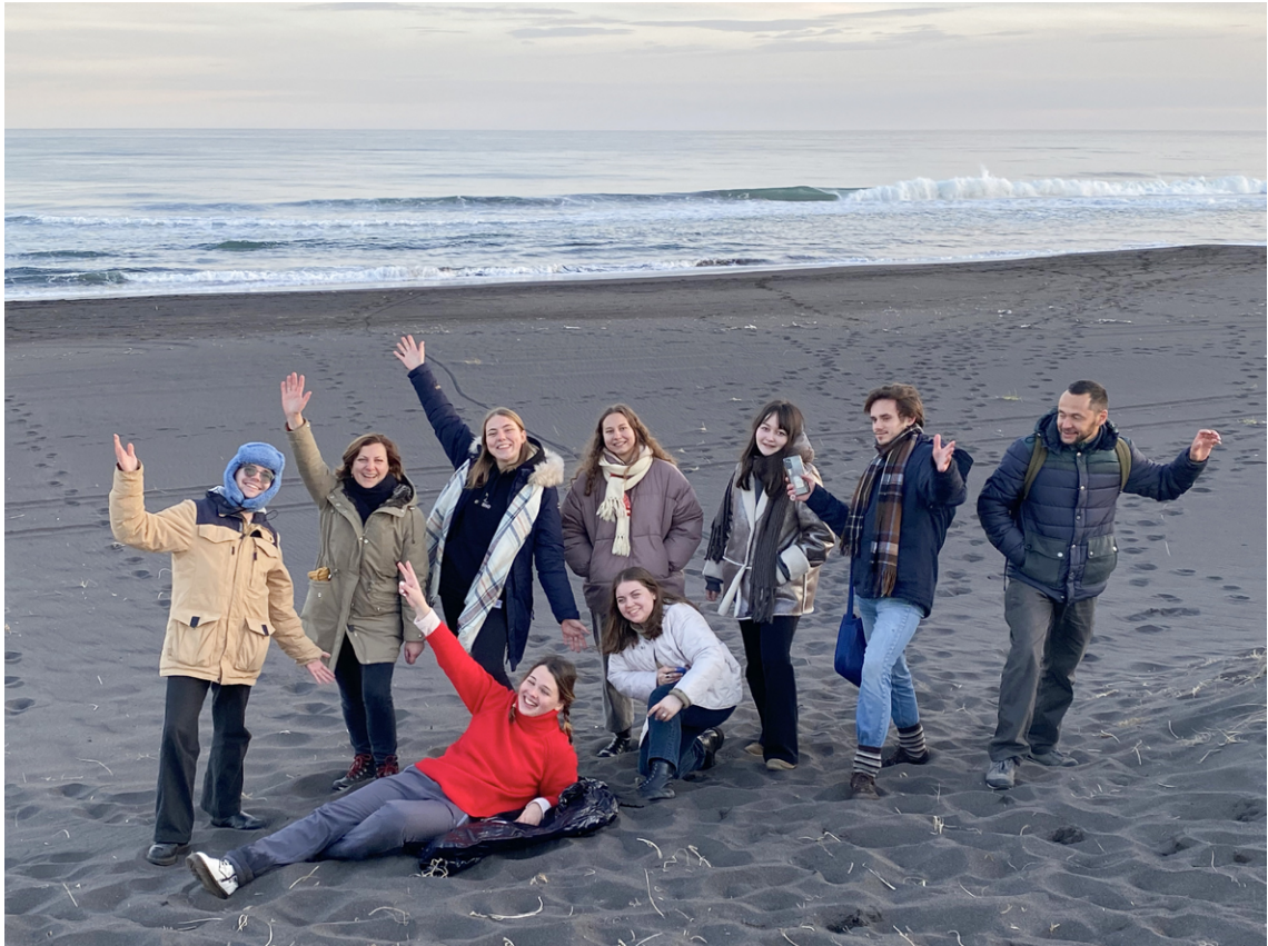
Участники экспедиции.

мигрантских сообществ, основанных на социальных связях приехавших на полуостров соотечественников и поддерживаемых несколькими объединениями. Однако включены в эти связи преимущественно те, кто намерен остаться на Камчатке надолго, в то время как те, кто рассматривает свое пребывание как временное, обычно не выходят за достаточно узкий круг близких друзей и родственников, с которыми или по совету которых приехали на полуостров.