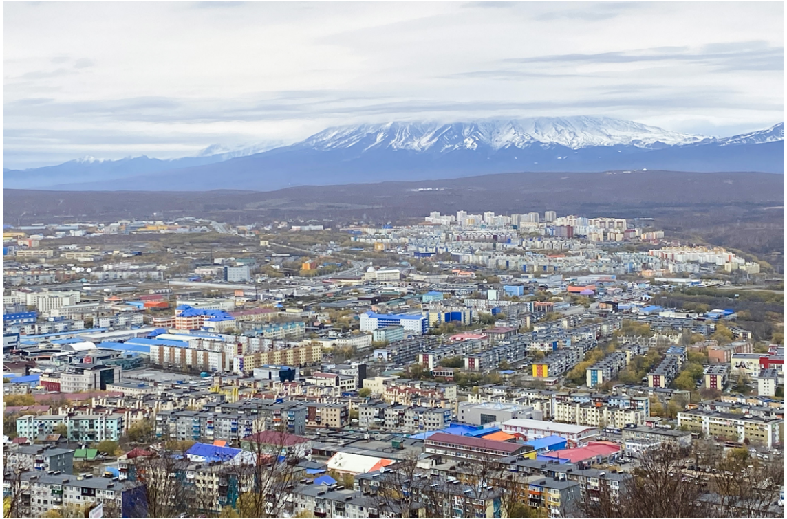
Вид на один из районов Петропавловска-Камчатского.

Выборка была ограничена мигрантами из стран Средней Азии, так как известно, что поток трудовой миграции именно из этих стран увеличился в последние годы. Были проведены интервью как с мужчинами ( N = 23 ), так и с женщинами ( N = 16 ) — все они изначально приехали на Камчатку с целью заработка. В ходе интервью не всегда удавалось уточнить возраст и образование (особенно в случае экспресс-интервью), однако все информанты были совершеннолетними, в возрастном диапазоне от 20 до 50 лет. Все интервью были записаны на диктофон и затем расшифрованы.