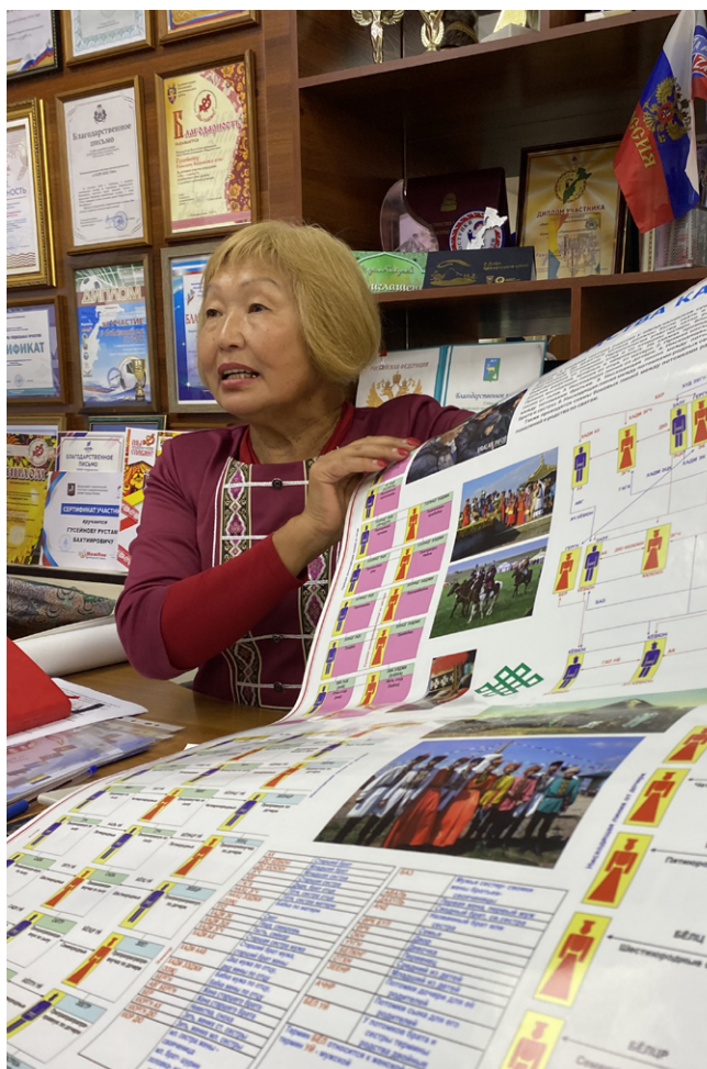
Председатель ассоциации, отвечающая за межэтнические отношения в Камчатском крае.

Для этой девушки, как и для других молодых людей, решивших остаться на Камчатке надолго, проводимые диаспоральными объединениями мероприятия служат местом встречи, общения и поддержки. Одна из руководительниц такого объединения рассказывала, что у них есть чаты, в которых обсуждают, как получить необходимые документы, как устроить детей в школу. В случае, если возникает какой-то непредвиденный случай, участники чатов помогают друг другу, собирая деньги (один из таких случаев — помощь семье мигранта, погибшего на работе, обсуждался непосредственно в ходе нашей встречи с главой диаспоры). По ее словам, есть специальный фонд пожертвований членов ассоциации, который поддерживает семьи в таких случаях.