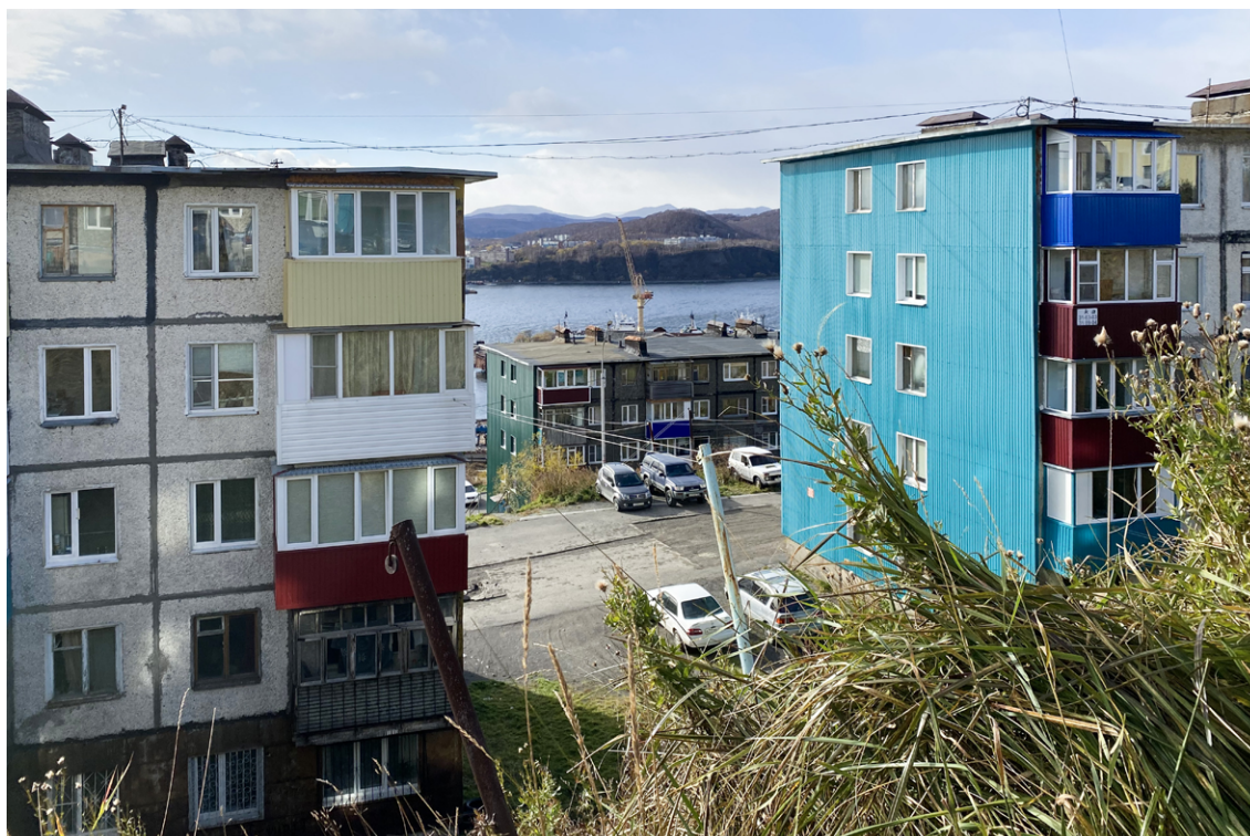
Окраинные кварталы города.

Хабаровск, Новосибирск). Они сравнивали свои зарплаты с тем, что зарабатывают их соотечественники в Москве, а некоторые утверждали, что их доход выше столичного 16 . Одновременно с этим затраты на жилье и повседневные нужды (например, транспорт) в Петропавловске-Камчатском ниже. В итоге разница между доходами и расходами получается в пользу Камчатки: мигранты говорили, что им выгодно жить и работать на полуострове, даже несмотря на довольно дорогой перелет.