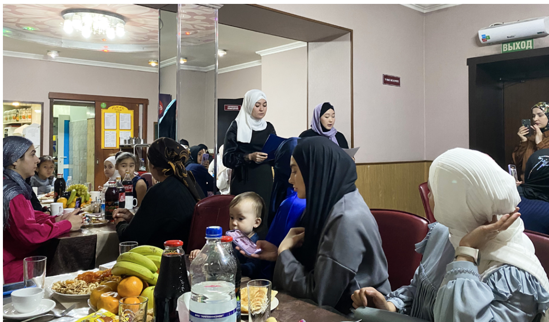
Собрание женщин-мусульманок города.

Еще один пример объединения женщин с миграционной историей — клуб мусульманок, организованный женой имама. По традиции стран Средней Азии в мечеть или молельный зал по пятницам и праздникам приходят только мужчины. Будучи на связи