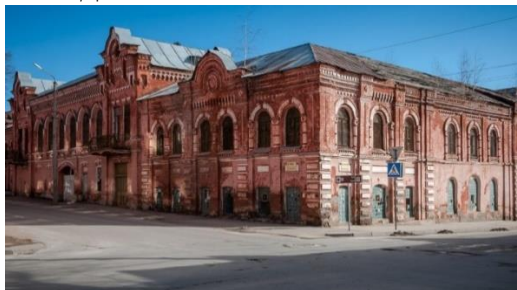
Рисунок 3. Современный вид Елецкой табачной фабрики

Более полутора века прошло с момента создания фабрики и активной предпринимательской деятельности Заусайловых. Но и сегодня город хранит память о династии елецких купцов. Сегодня в центре города можно заметить красивое архитектурное здание