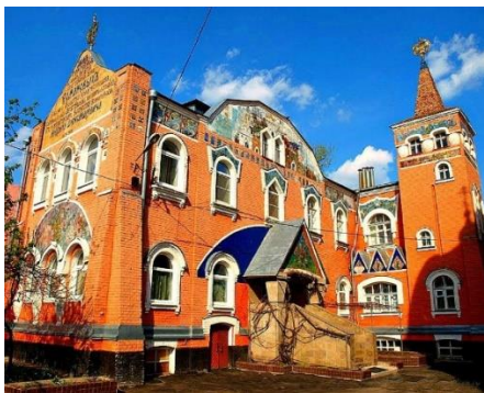
Рисунок 5. Дом призрения. Современный вид

фасад здания украшен изразцами, а также великолепным майоликовым панно с цветочным орнаментом. Кроме этого, можно заметить памятную надпись на старославянском языке, а также государственный герб, который венчает Дом призрения. Здание предназначалось для помощи людям и заботе о них.