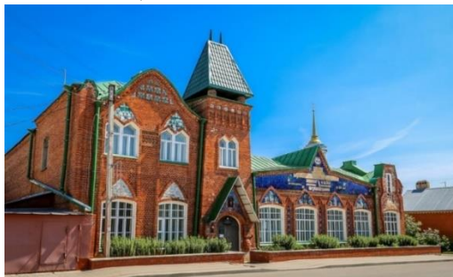
Рисунок 4. Бывшие ясли при Елецкой табачной фабрике. Музей народных ремёсел и промыслов. Современный вид

здание было украшено керамическим декором. До революции на фасаде приюта можно было увидеть такую надпись: «Состоят в ведомстве учреждений Императрицы Марии приют и ясли, основанные Варварой Васильевной Заусайловой в 1900 году». В настоящее время это здание является филиалом Елецкого городского краеведческого музея «Музей народных ремёсел и промыслов».