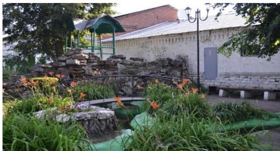
Рисунок 8. Парковая архитектурная композиция «Грот» А.Н. Заусайлова. Современный вид

раскидистый фонтан и с какой-то женской роскошью пахло цветами в бодром и студеном воздухе багряного осеннего заката, но народу было мало...»[2]. Кроме того, совсем рядом с Городским садом располагался ботанический сад, основанный Александром Николаевичем Заусайловым.