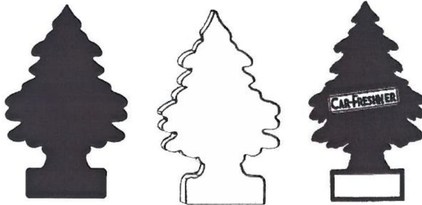
КАРТОЧКА № 4