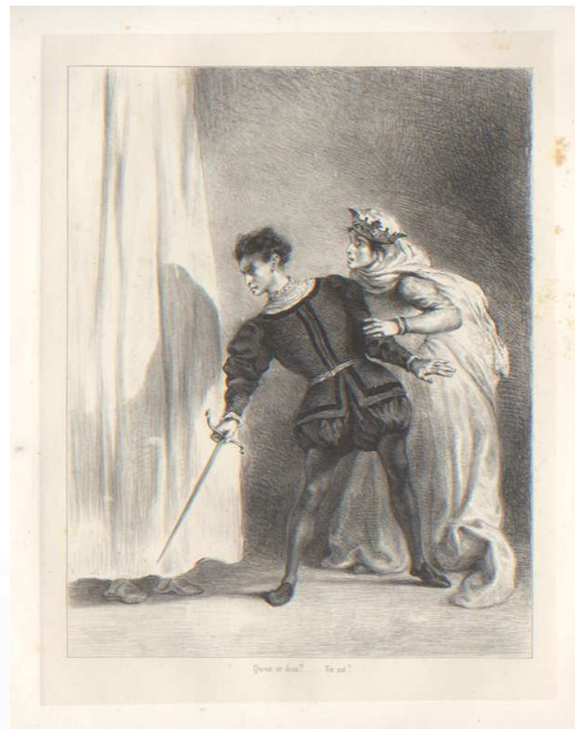
Шекспир. «Гамлет» (акт III, сцена 4)