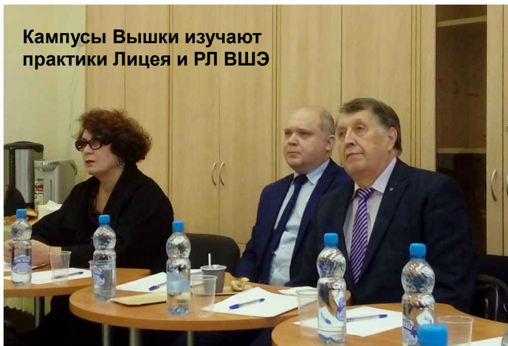
Кампусы Вышки изучают практики Лицея и РЛ ВШЭ