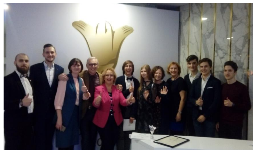
Конкурс «Золотая Вышка»: впервые вместе – ученики и учителя