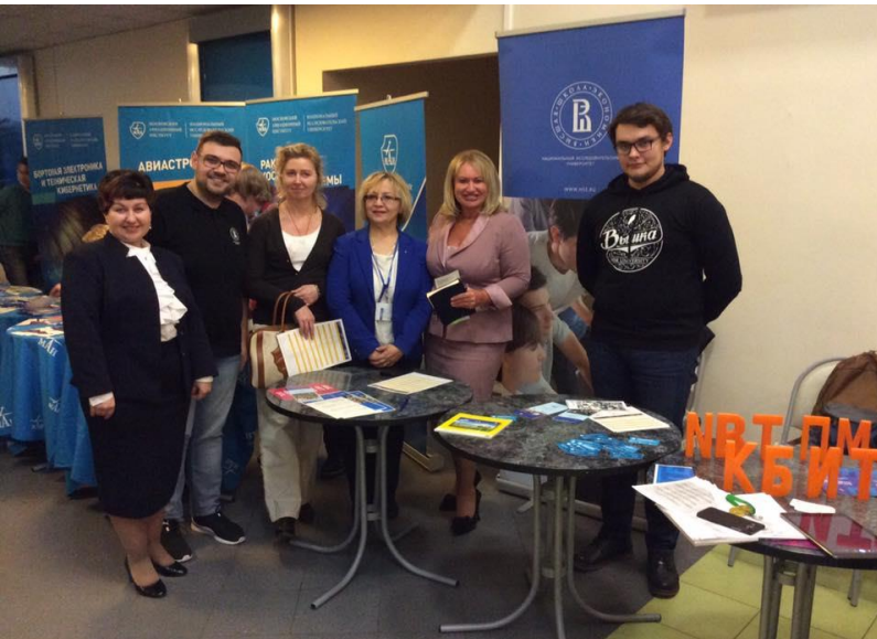
Распределенный лицей: учим и учимся