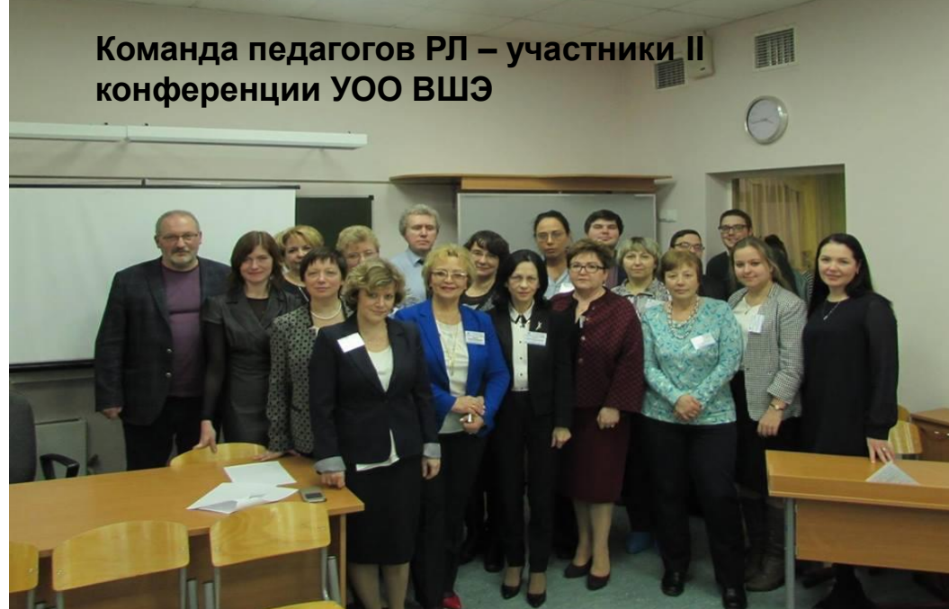
Команда педагогов РЛ – участники II конференции УОО ВШЭ