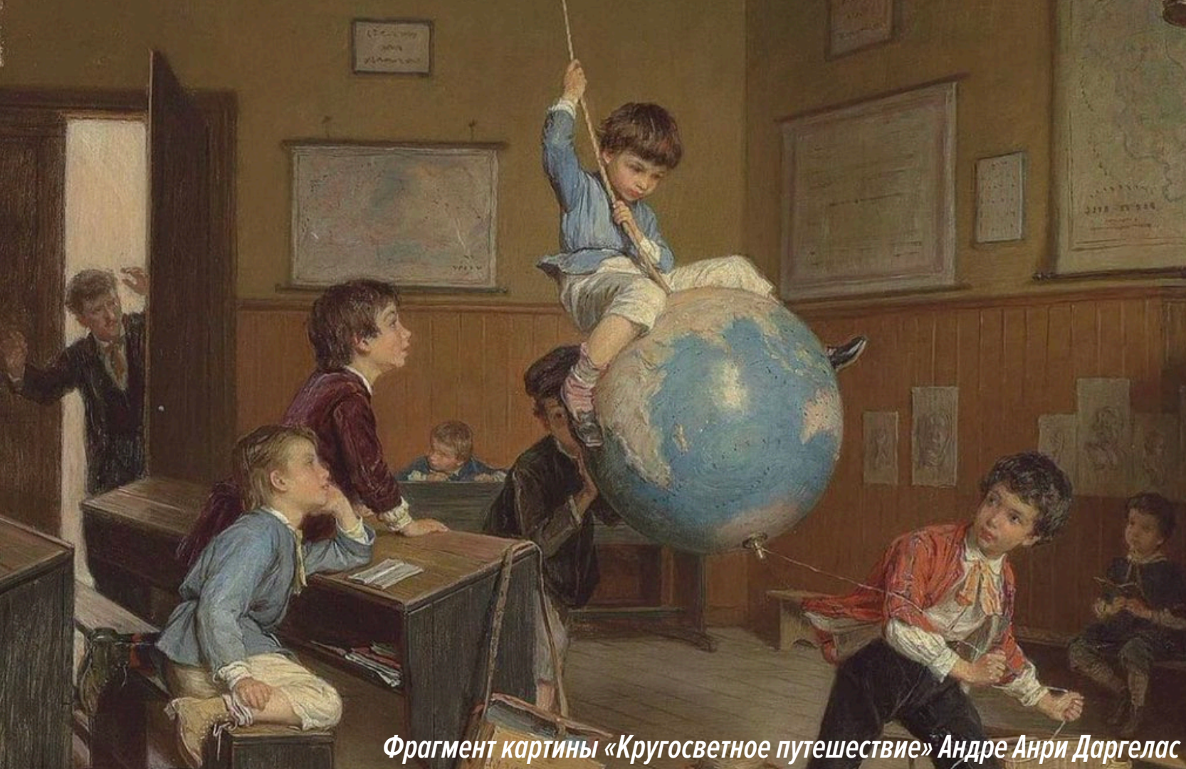
Фрагмент картины «Кругосветное путешествие» Андре Анри Даргелас