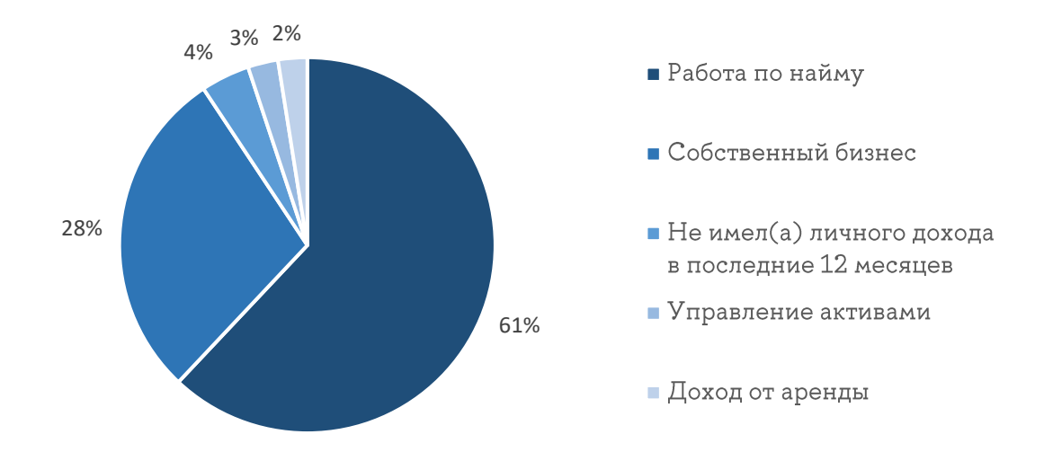
Рисунок 2 — Занятие, приносящее основной личный доход (допускался один ответ)

Среди опрошенных, работающих по найму, сравнительно больше проживающих в Москве и Санкт-Петербурге (64% против 46% имеющих собственный бизнес и 49% получающих пассивный доход), что, вероятно, является следствием высоких зарплат в двух столицах.