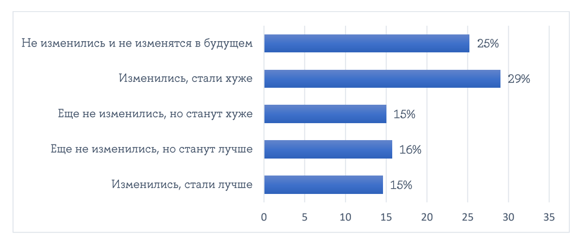
Рисунок 4 — Как изменились возможности получения дохода под влиянием текущих экономических трендов