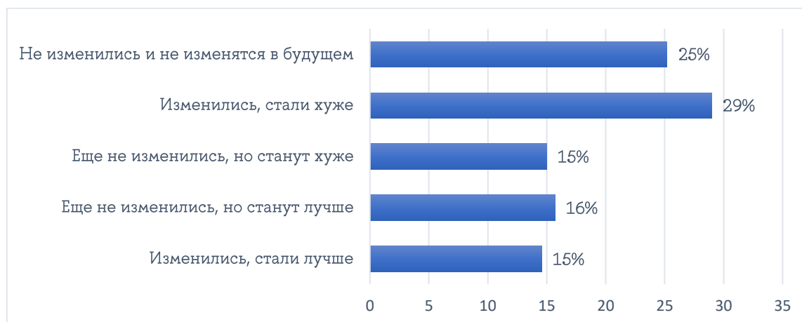
Рисунок 4 — Как изменились возможности получения дохода под влиянием текущих экономических трендов