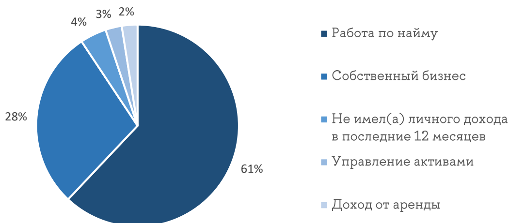
Рисунок 2 — Занятие, приносящее основной личный доход (допускался один ответ)

Среди опрошенных, работающих по найму, сравнительно больше проживающих в Москве и Санкт-Петербурге (64% против 46% имеющих собственный бизнес и 49% получающих пассивный доход), что, вероятно, является следствием высоких зарплат в двух столицах.